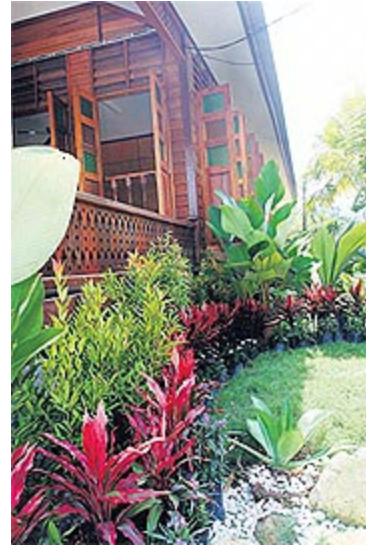
Keliling rumah ditutupi pepohon seperti puding dan calathea.