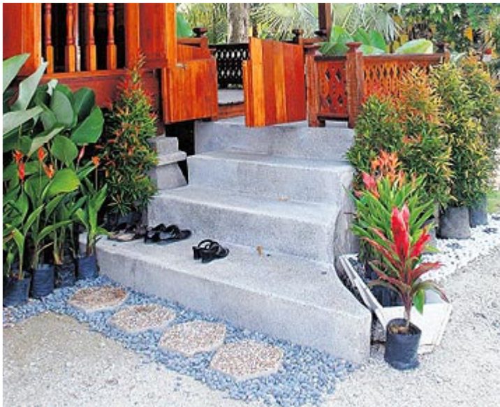
Pemijak kaki dari batu sungai di kaki tangga.

Batu-batu sungai dan kelikir berwarna putih atau warna asalnya juga sesuai menghias batu atau taman tempat pepohon ditanam.